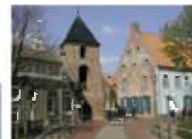
Greetsiels historischer Ortskern mit seinen restaurierten Giebelhäusern und alleinartigen Klinkerstraßen