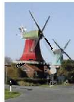
Das Wahrzeichen von Greetsiel - die ca. 21 Meter hohen Zwillingsmühlen am südlichen Ortseingang

Von hier aus erreichen Sie in wenigen Minuten den idyllischen Hafen, die Zwillingsmühlen und das Zentrum mit den historischen Häuserfassaden und malerischen Gassen aus dem 17. Jahrhundert. Dort finden Sie auch ausreichende Auswahl an Gastronomie und Geschäften, die zum Verweilen einladen.