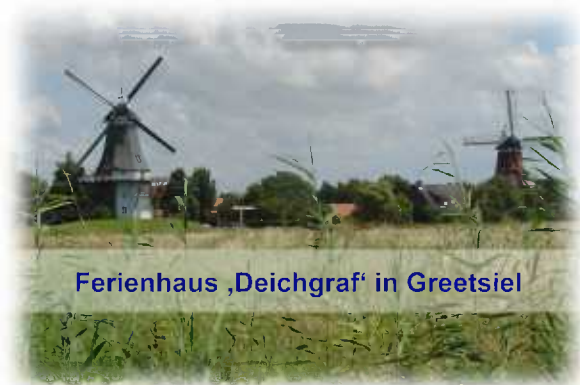
Ferienhaus ‚Deichgraf‘ in Greetsiel