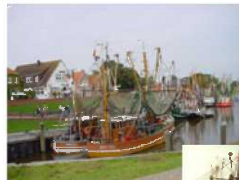
Im verträumten tidenunabhängigen Hafen von Greetsiel liegt die größte Krabbenkutterflotte Ostfrieslands vor Anker

Unser im Frühjahr 2000 erbautes Nichtraucher-Ferienhaus befindet sich, eingebettet in einer ruhigen Wohnsiedlung, in zentraler und zugleich ruhiger Lage am Rande des historischen Ortskern von Greetsiel.